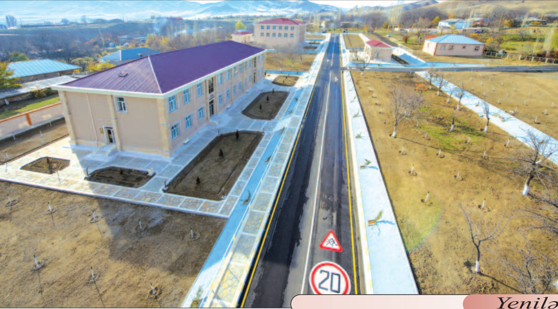
Yeni inşa edilən kəndlərimiz

Culfa rayonunun Qazançı kəndi ölkəmizin ən qədim yaşayış məskənlərindən biridir. Ərazidə Tunc və İlk Dəmir dövrlərinin abidəsi olan Qazançı qalası, orta əsrlərə aid Qazançı körpüsü, ətrafdakı bir neçə kənd xarabalıqları, karvansaray və sair abidələr də bunu sübut edir. Bu kəndin daşdığı ad zahirən bir neçə mənaya uyğun gəlir. Toponimlə və onun etimologiyası ilə daha dəqiq elmi məlumat əldə etmək üçün bu barədə fikir söyləmiş bir neçə tədqiqatçının əsərlərini vərəqlədim.